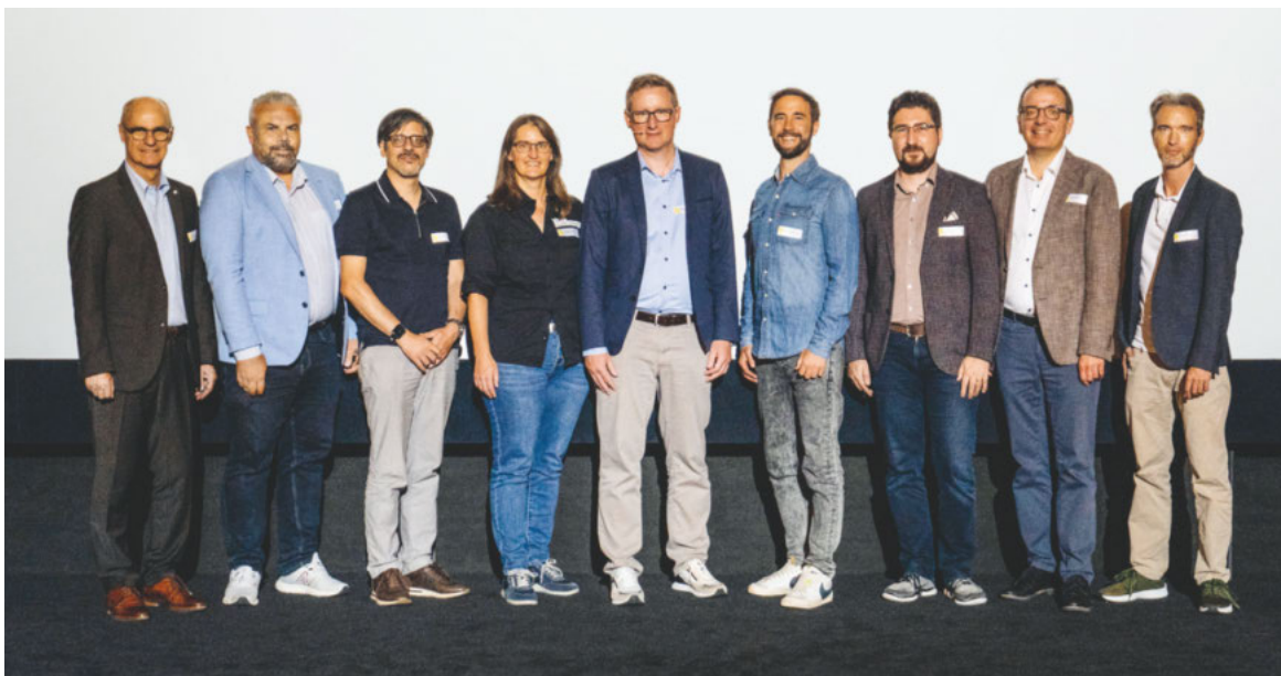
Die Referentin und die Referenten zeichneten für die spannenden Inhalte verantwortlich.

Save the date! Nächste Fachtagung Digitalisierung: 19. September 2024