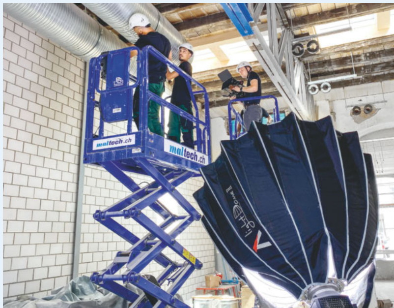
Eindrückliches Equipment für eindruckliche Bewegtbilder.

Werbematerial für Mitglieder: suissetec.ch/nachwuchs