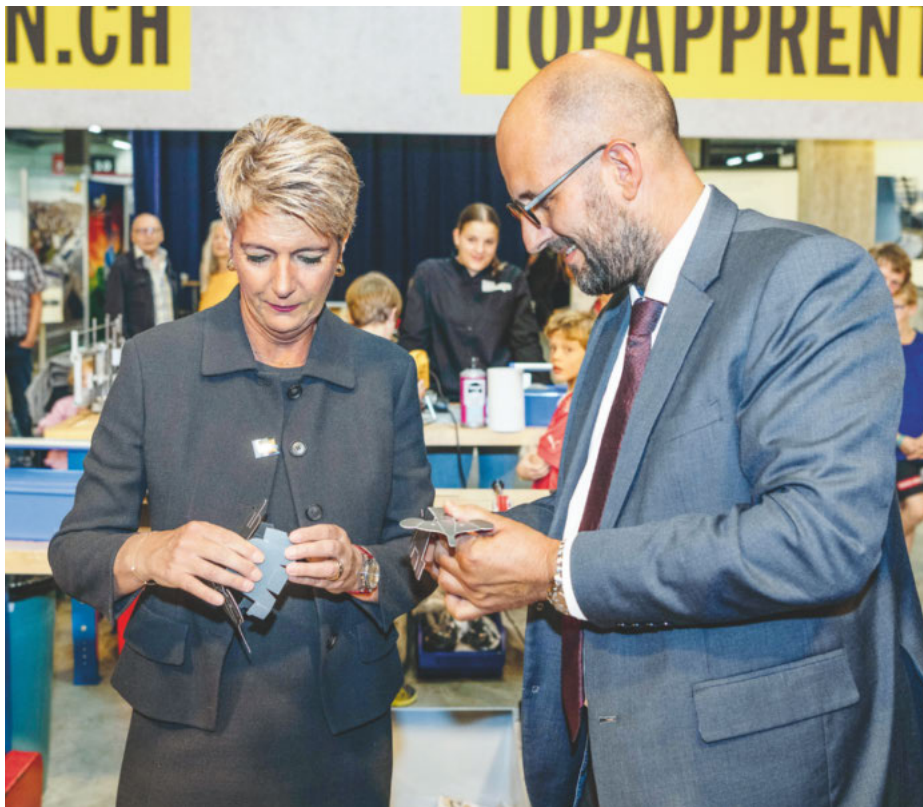
Auch Bundesrätin Karin Keller-Sutter versuchte sich bei ihrem Besuch am suissetec Stand im Elefantenbiegen.

Aus der ganzen Schweiz reisten die jungen Gebäudetechnikprofis – darunter auch elf Frauen und sechs Romands – an die grösste Publikumsmesse der Schweiz. Während zehn spannenden Wettkampftagen konnten die Besuchenden der Olma mitverfolgen, wie die Kandidaten ihre anspruchsvollen Wettkampfaufgaben unter Zeitdruck meisterten. Am letzten Messetag wurden die Siegerinnen und Sieger dann bei einer imposanten Schlussfeier gekürt.