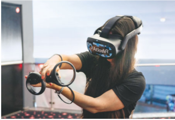
Das neue VR-Training konnte im Anschluss an die Tagung ausprobiert werden.