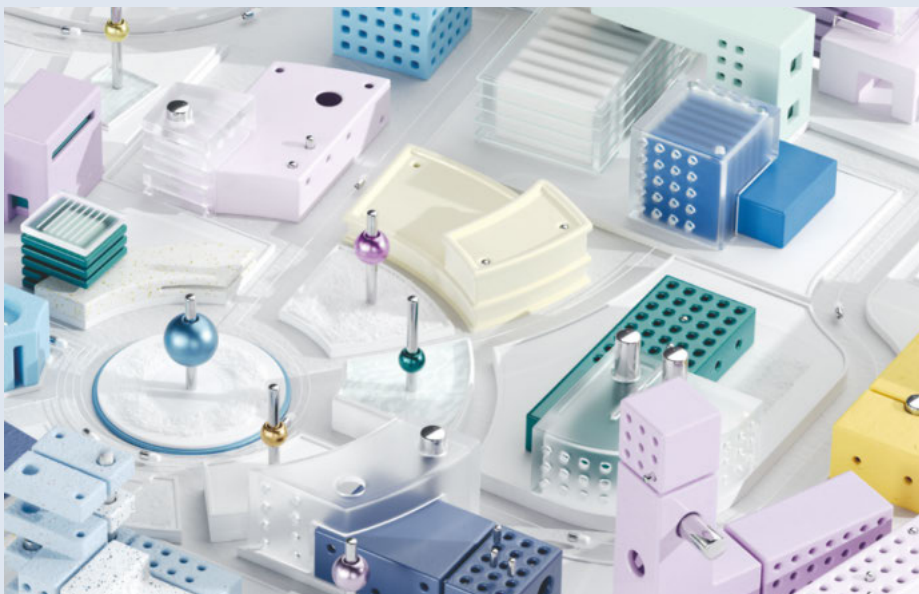
Ausschnitt der suisse- tec Bildungslandschaft.

Landschaft – alles aus Sicht der Gebäudetechniker. «Wir wollten die Komplexität des Bildungsdschungels reduzieren», erklärt Alois Gartmann, Initiator der suisse- tec Bildungslandschaft. Zudem war es der Wunsch, die Plattform auf verschiedene Zielgruppen auszurichten. Die Bildungslandschaft richtet sich sowohl an (zukünftige) Gebäudetechniker/-innen als auch an Eltern, Lehrpersonen, Quereinsteiger, Jugendliche usw. Interessierte können sich auf dieser Plattform eine Übersicht verschaffen, die eigenen individuellen Karriereoptionen planen oder sich einfach inspirieren lassen. «Wichtig ist: Die Bildungslandschaft lebt! Sie wird sich in den nächsten Wochen noch weiterentwickeln!», betont Alois Gartmann und meint damit, dass die «Stadt» noch mit weiteren Links und Inhalten ergänzt und aktualisiert wird und immer auf aktuellem Stand bleibt. (vivm) <